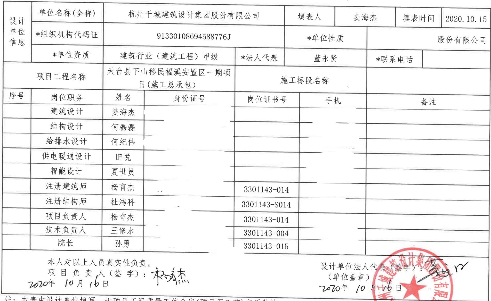
台州市施工现场主要人员一览表(设计单位)